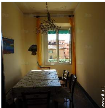
sala da pranzo