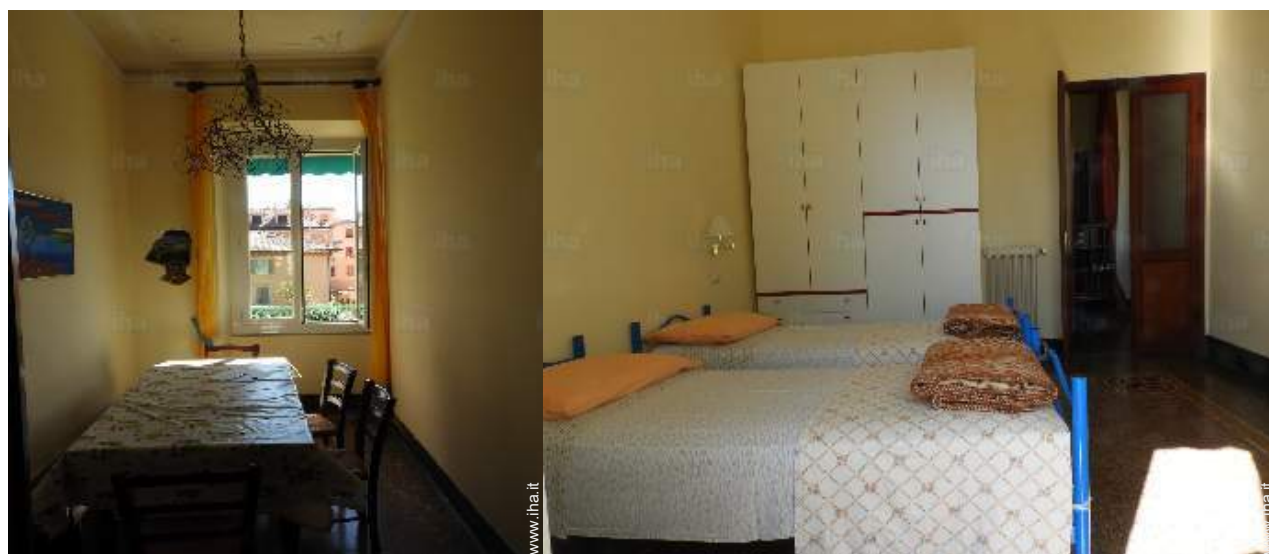
sala da pranzo