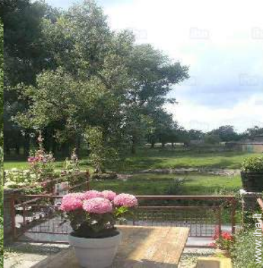
vista dalla veranda