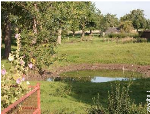
vista sul tramonto