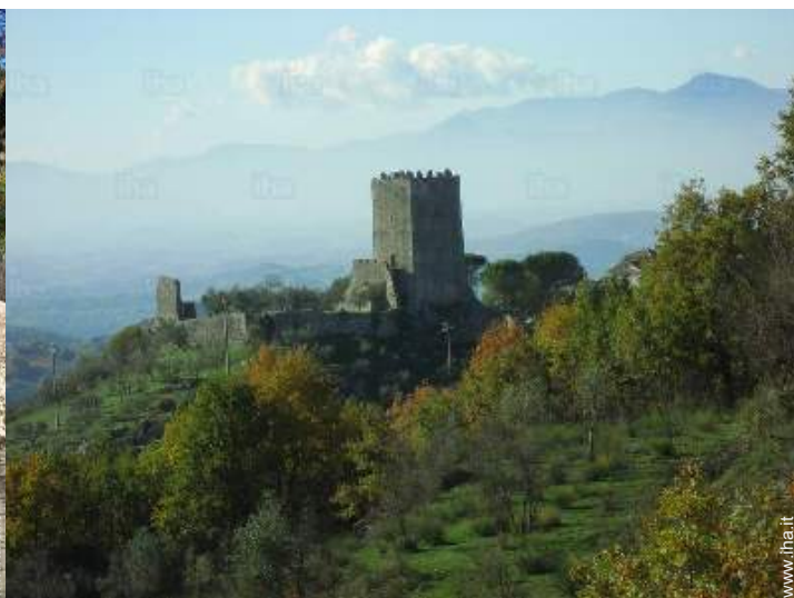
Città nelle vicinanze