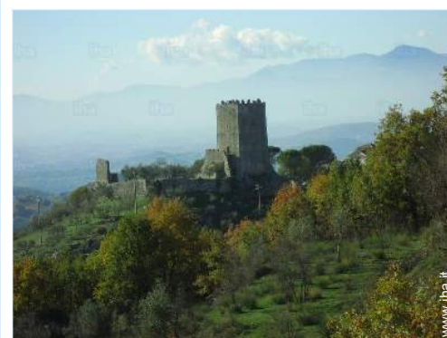
Città nelle vicinanze

Asilo 15km Centro città 7,5km Fermata/stazionamento bus 7,5km Bus navetta spiaggia 15km Noleggio biciclette/mountain bike 15km Noleggio di moto/scooter 15km Noleggio auto 15km Noleggio attrezzatura di sci 50km Noleggio biancheria/lavanderia 15km Panetteria 7,5km Negozi tipici 7,5km Supermercato 7,5km Salone di coiffure 7,5km Internet café 5km Ufficio postale 7,5km Banca 7,5km Farmacia 7,5km Medico 5km Ospedale 15km Ambulatorio 7,5km