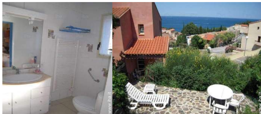
vista dal terrazzo