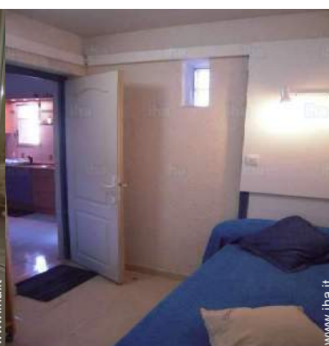
camera dei bambini