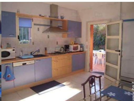
cucina in stile americano