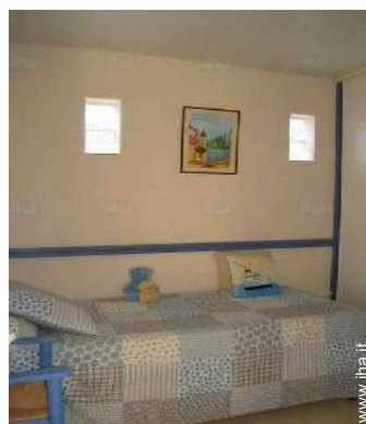
camera dei bambini