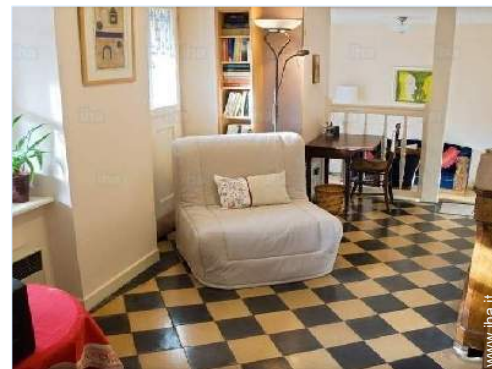
divano(i) letto 1 pers

Tavolo da giardino, 4 sedia(e) da giardino, ombrellone, 2 chaise(s) longue(s)