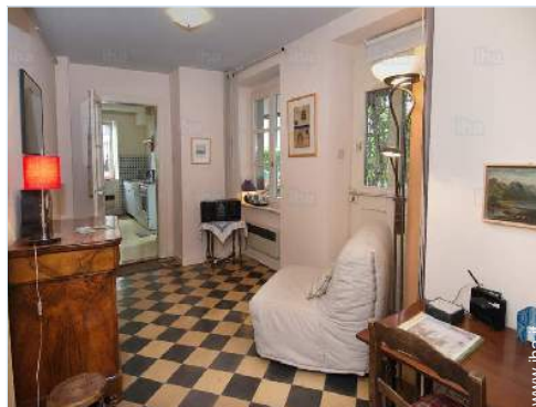
vista dal salone