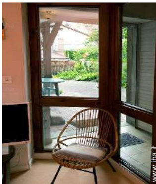
vista dal salone