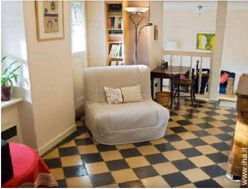
divano(i) letto 1 pers