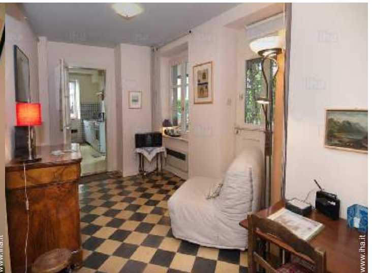
vista dal salone