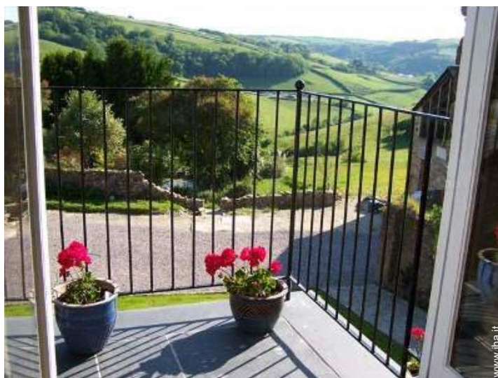
vista sui campi agricoli