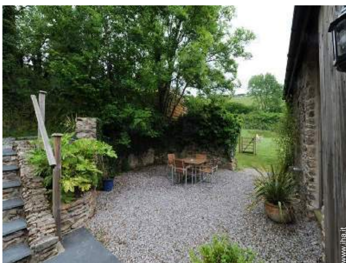
vista sul giardino/parco