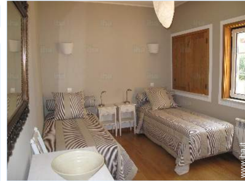
stanza degli ospiti

Barbecue, 10 sedia(e) da giardino, salotto da giardino, 10 chaise(s) longue(s), doccia esterna