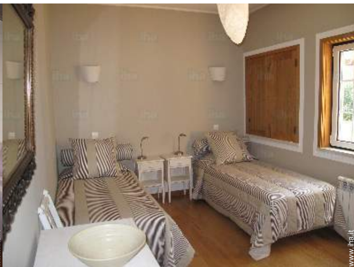
stanza degli ospiti