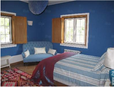
stanza degli ospiti