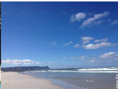
attività balneari nelle vicinanze