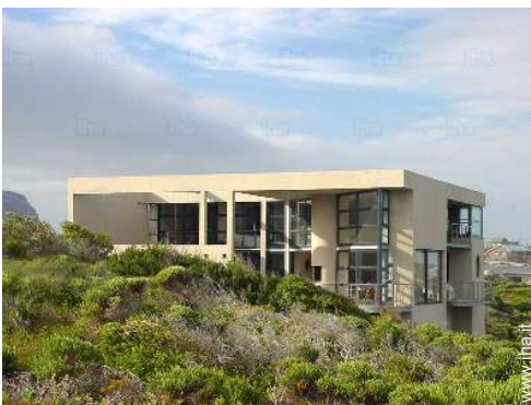
Proprietà di Prestigio