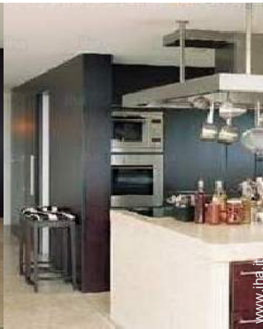
grande cucina in stile americano