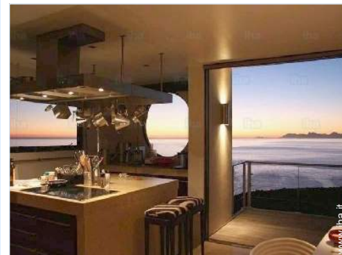
vista sul tramonto