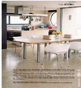
grande cucina in stile americano