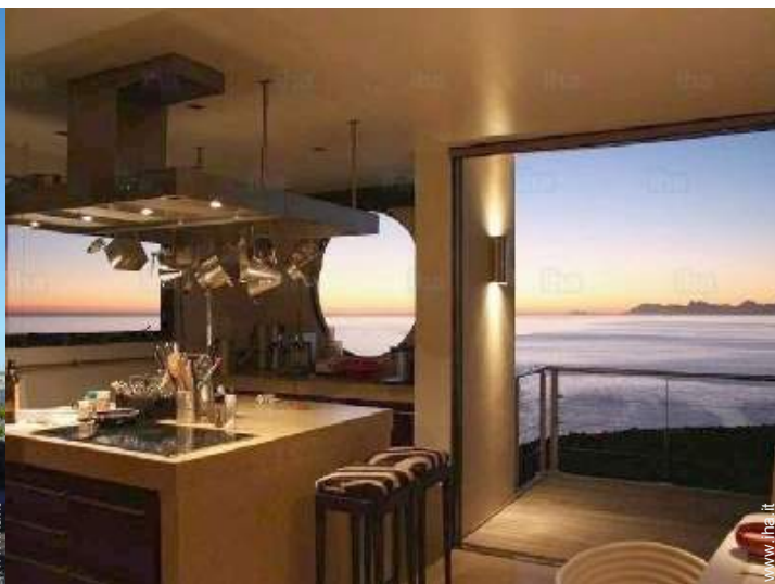
vista sul tramonto