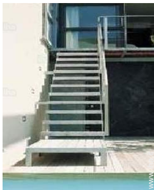
luogo per bagnarsi