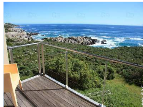
vista sul mare

Barbecue, tavolo da giardino, 12 sedia(e) da giardino, 5 chaise(s) longue(s), doccia esterna