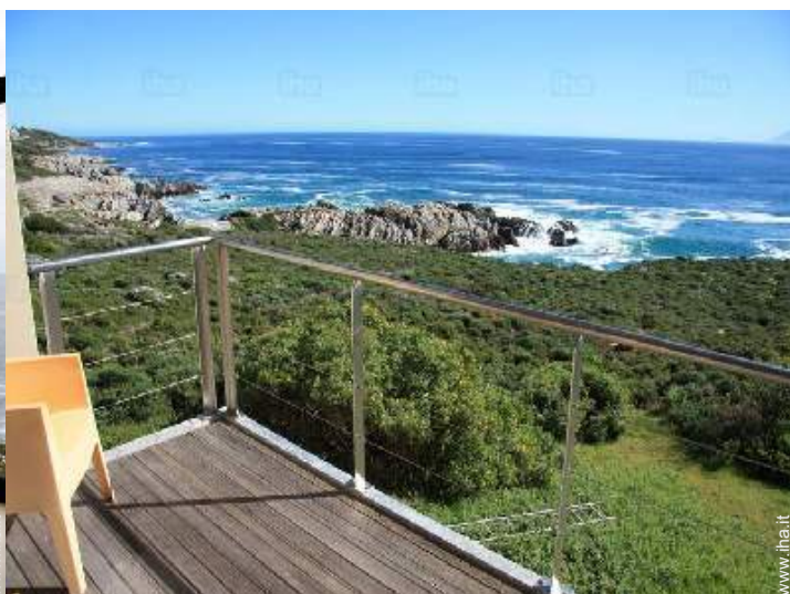
vista sul mare