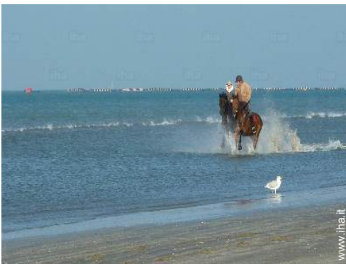
passeggiata a cavallo