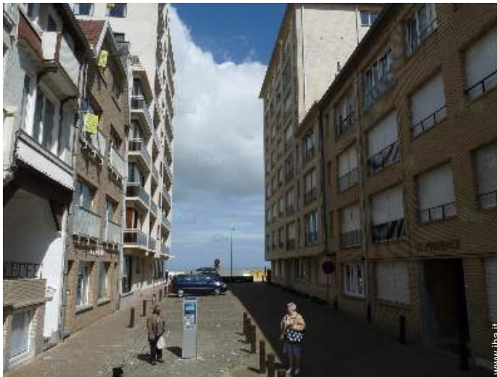
accesso diretto alla spiaggia