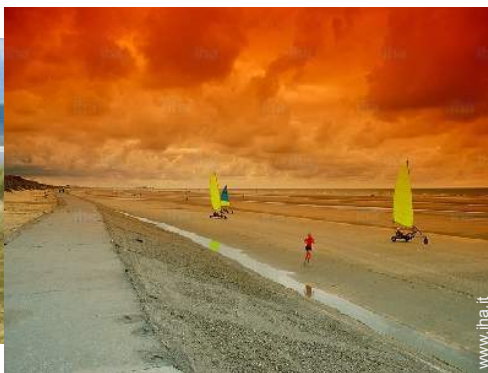
surf su sabbia