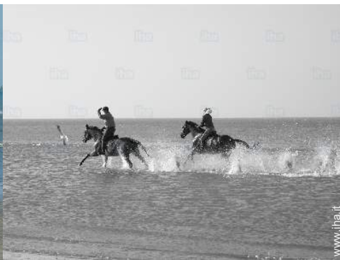
passeggiata a cavallo