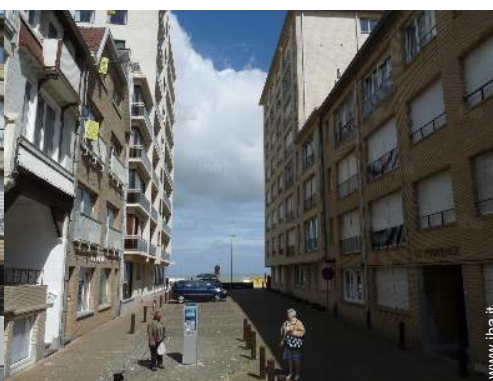
accesso diretto alla spiaggia