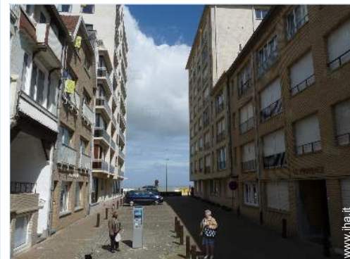
accesso diretto alla spiaggia