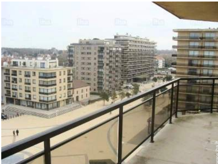
vista sulla piazza