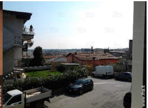
vista dalla casa