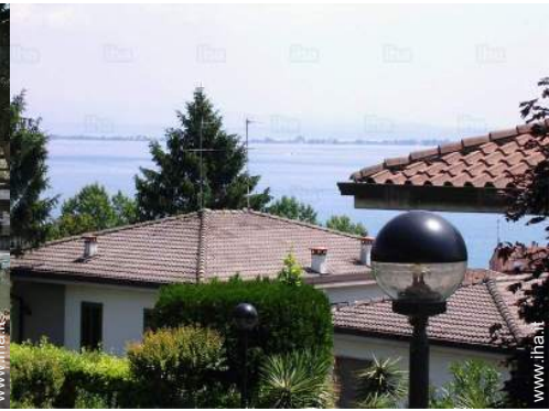
vista dalla camera