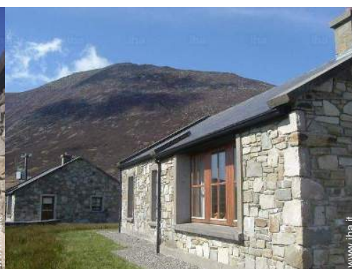
vista dal patio