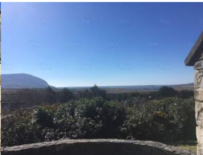
vista dal patio