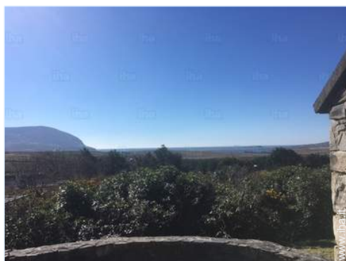
vista dal patio