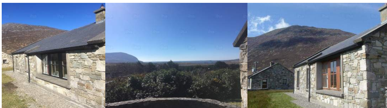
vista dal patio