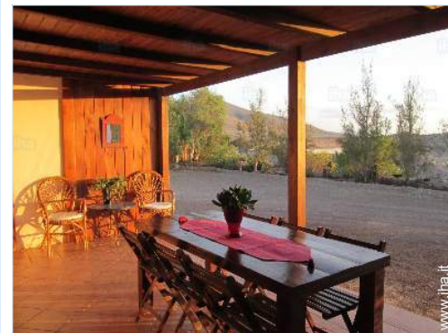
tavolo da giardino

Noleggio biciclette/mountain bike Noleggio di moto/scooter Panetteria Negozi tipici Supermercato Internet café Banca Distributore automatico di biglietti Farmacia Medico