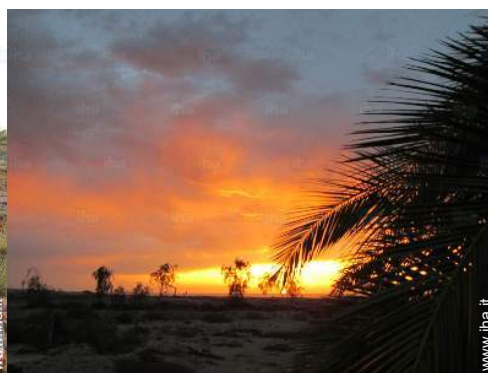
vista sul tramonto