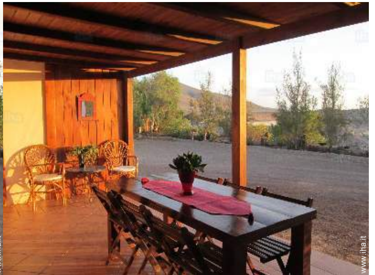
tavolo da giardino