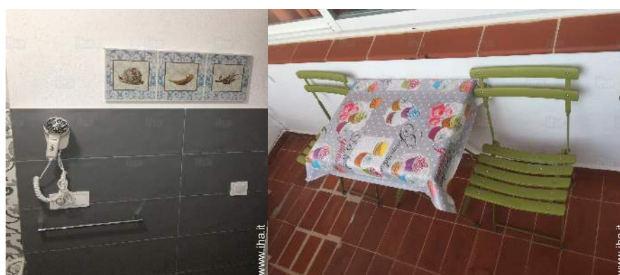
vista dal balcone