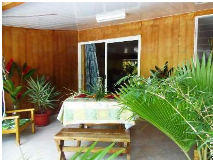
vista dal terrazzo coperto