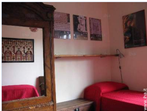
camera per ragazzi