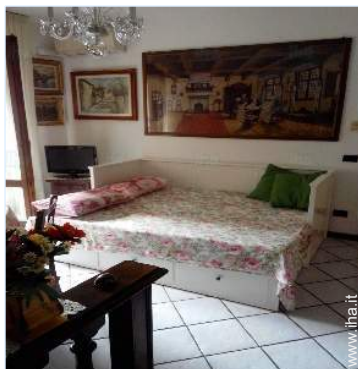
divano(i) letto 2 pers