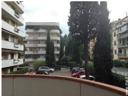
vista sul cortile