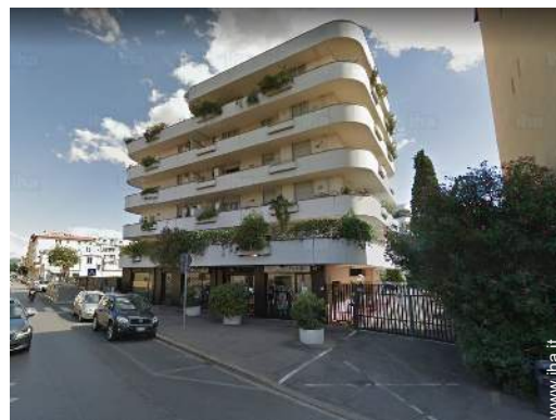
vista sulla città