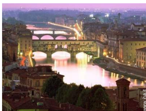
vista sulla città