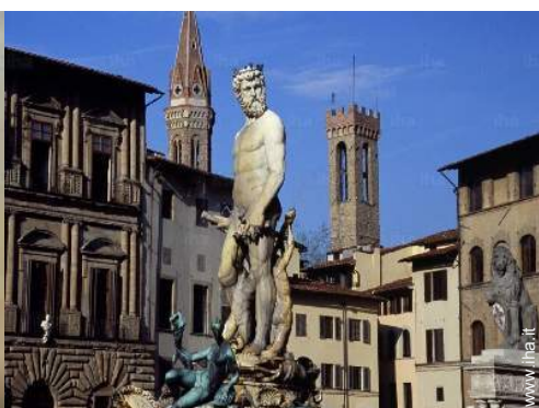
vista sul monumento