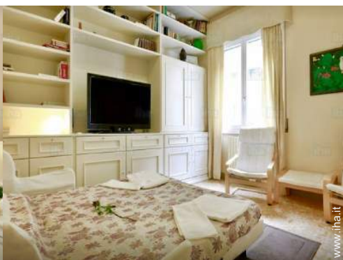
divano(i) letto 2 pers