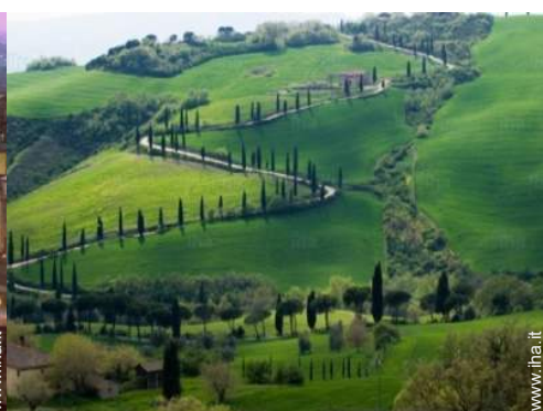
Attrazioni e relax