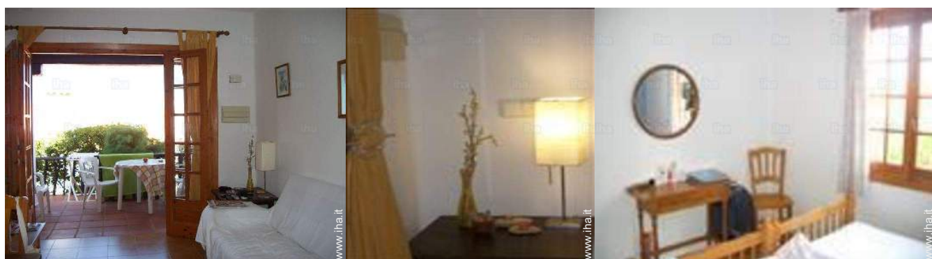
vista dal salone