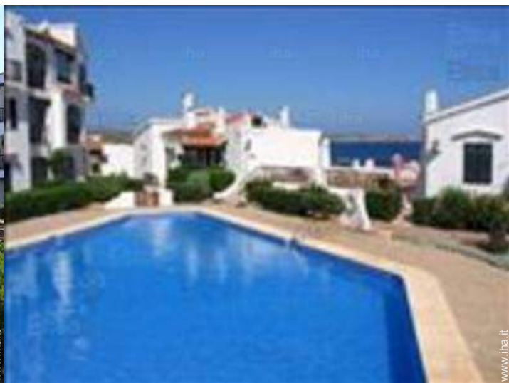
piscina in comune