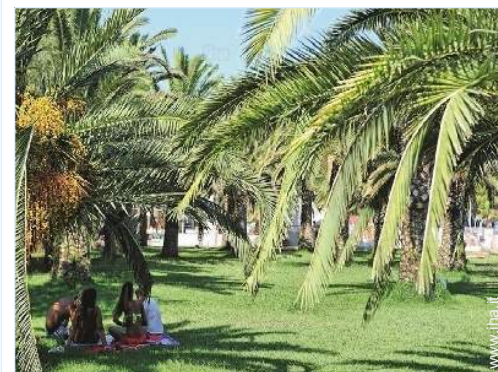
accesso diretto alla spiaggia

Spiaggia 200m Piscina pubblica Campo da tennis pubblico