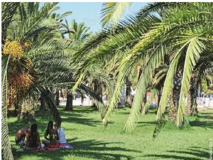
accesso diretto alla spiaggia