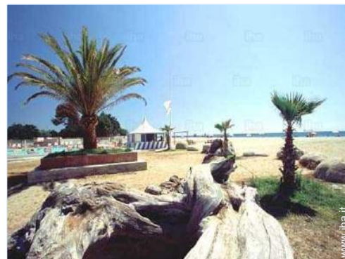
accesso diretto alla spiaggia