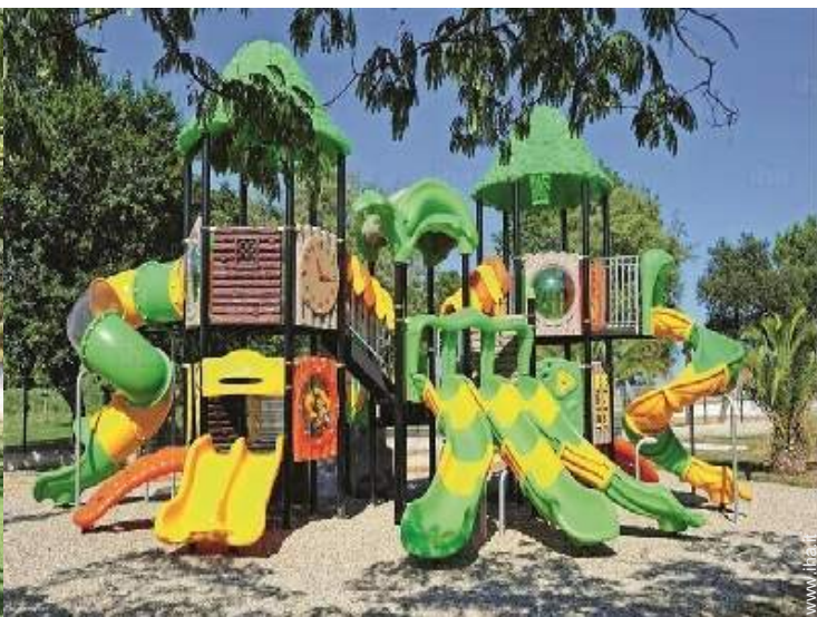
disposizione delle attrezzature ricreative