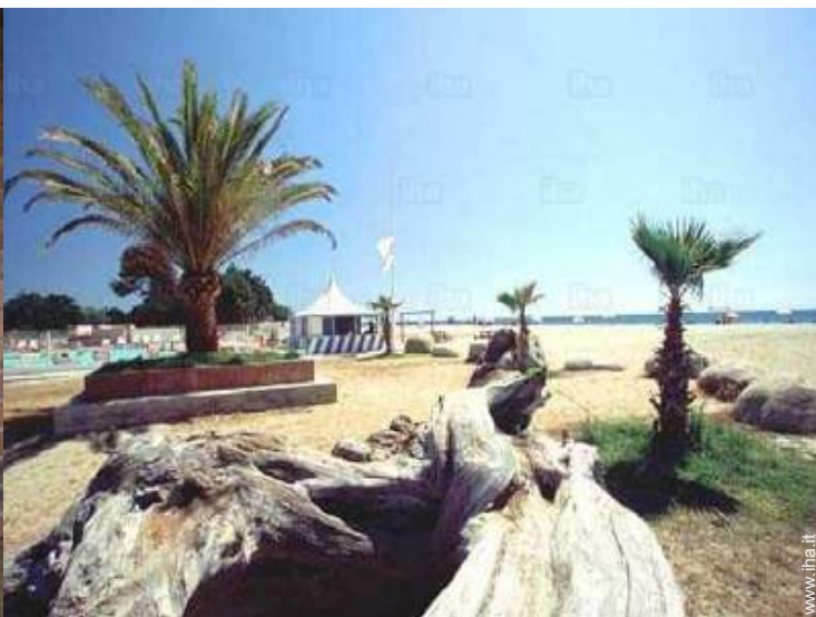
accesso diretto alla spiaggia