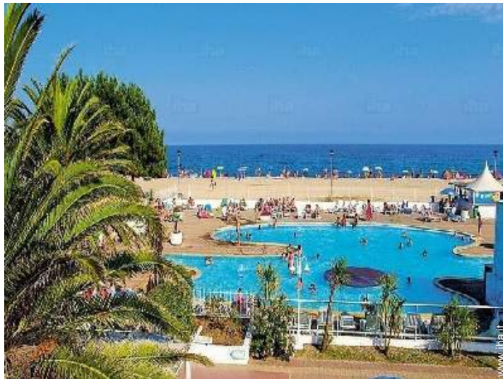
piscina in comune