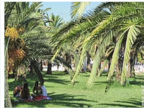
accesso diretto alla spiaggia

Noleggio biciclette/mountain bike Noleggio di moto/scooter Noleggio auto Noleggio barche Affitto materiale di immersione Noleggio biancheria/lavanderia Panetteria 200m Negozi tipici 200m Ufficio postale 4km Banca 4km Distributore automatico di biglietti 4km Farmacia 4km Infermiera 4km