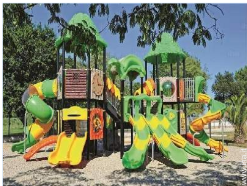
disposizione delle attrezzature ricreative