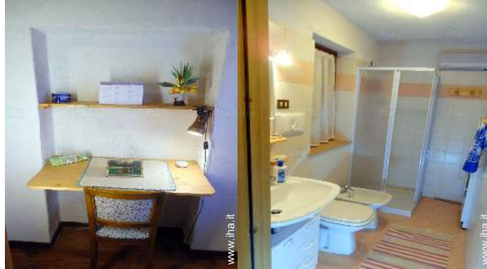
camera dei bambini