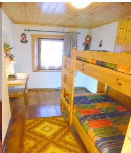
camera dei bambini