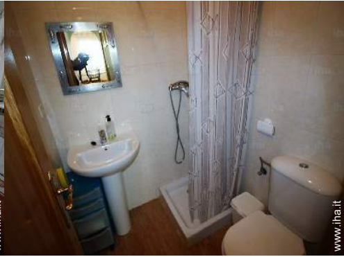
luogo per bagnarsi