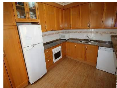
cucina in stile americano

Villaggio centro 3km Fermata/stazionamento bus 300m Panetteria 50m Negozi tipici 3km Supermercato 50m Salone di coiffure 3km Internet café 3km Ufficio postale 3km Banca 3km Distributore automatico di biglietti 3km Farmacia 3km Ospedale 4km Ambulatorio 3km