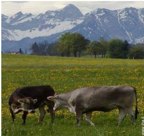
vista sulla montagna