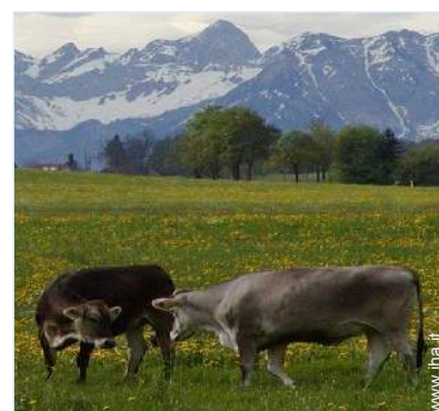
vista sulla montagna