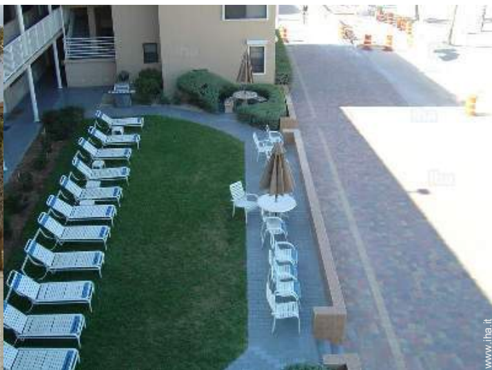
vista dalla terrazza sul tetto