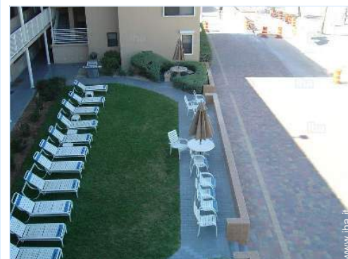
vista dalla terrazza sul tetto