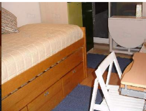
letto(i) a scomparsa 2 pers