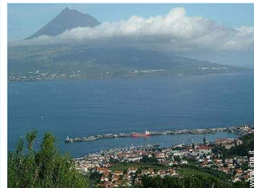
vista sulla città