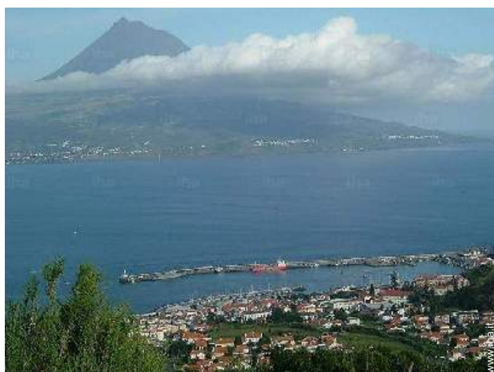
vista sulla città