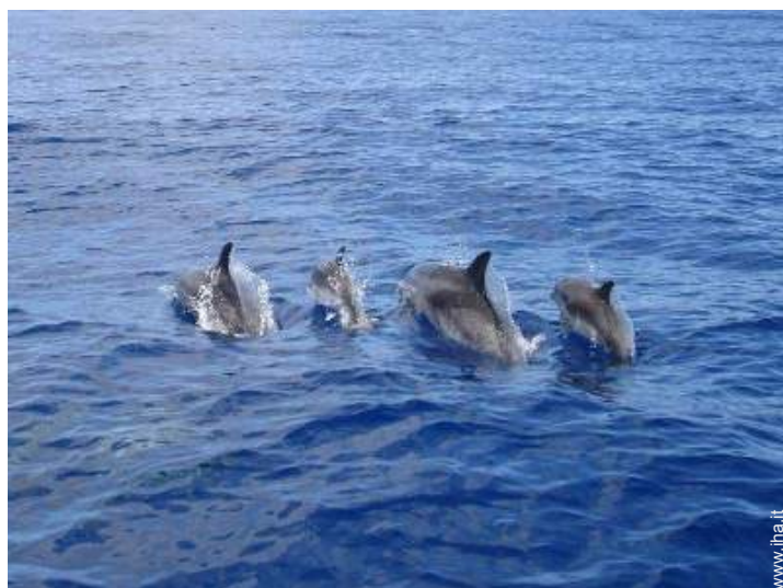
escursione in barca