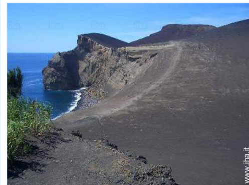
Attrazioni e relax