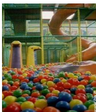
disposizione delle attrezzature ricreative