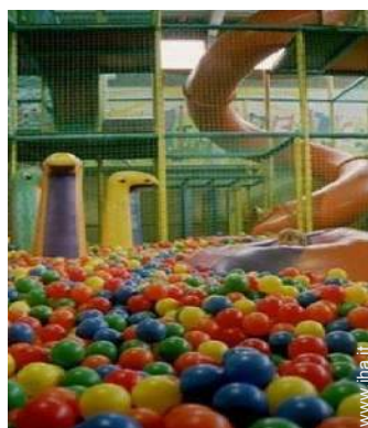
disposizione delle attrezzature ricreative