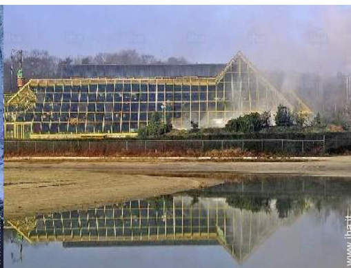
attività balneari nelle vicinanze