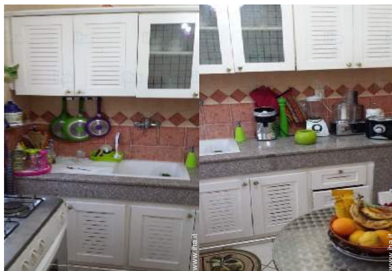
vista dalla cucina