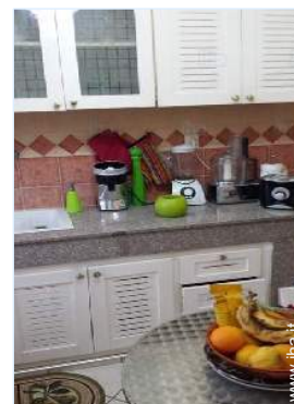
vista dalla cucina