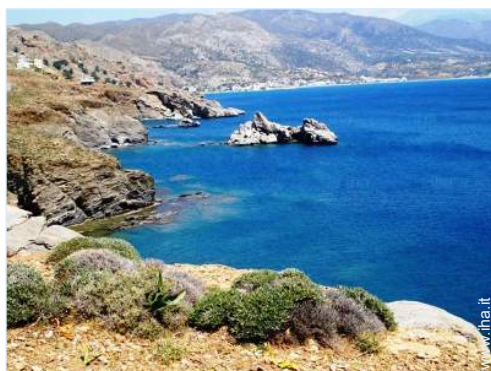
vista sul villaggio

Privilegi : Accesso diretto alla spiaggia