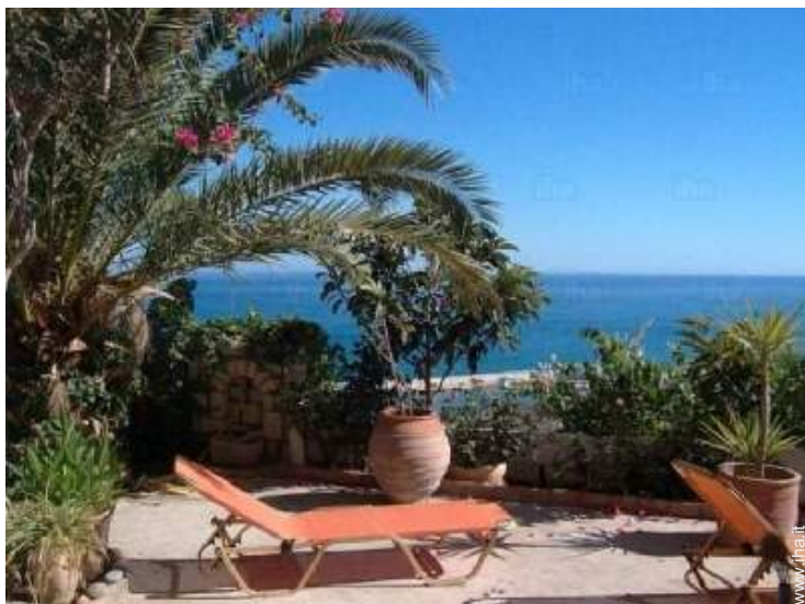
vista sul mare