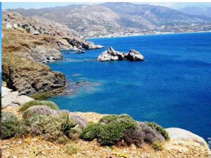
vista sul villaggio