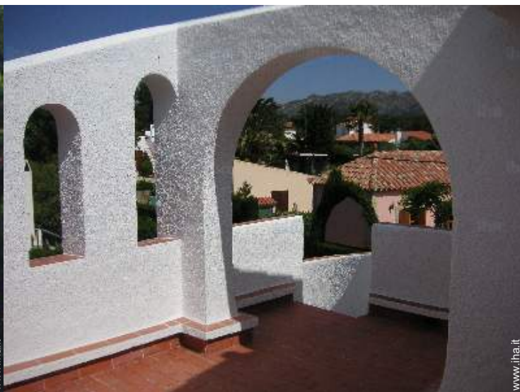
vista dalla terrazza sul tetto