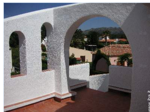
vista dalla terrazza sul tetto