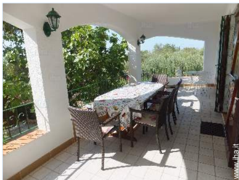
vista dal terrazzo