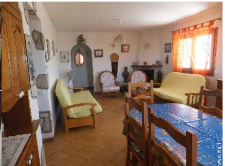
vista dalla sala da pranzo