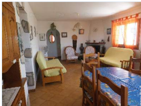
vista dalla sala da pranzo