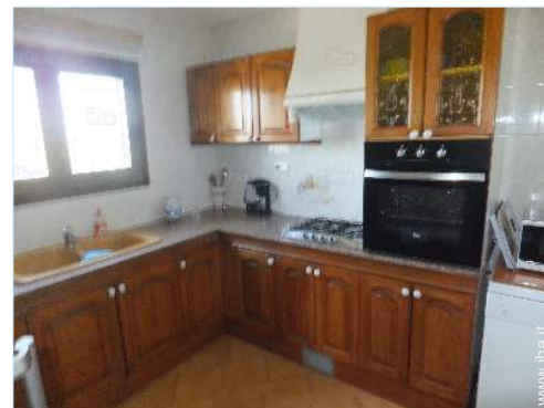
vista dalla cucina