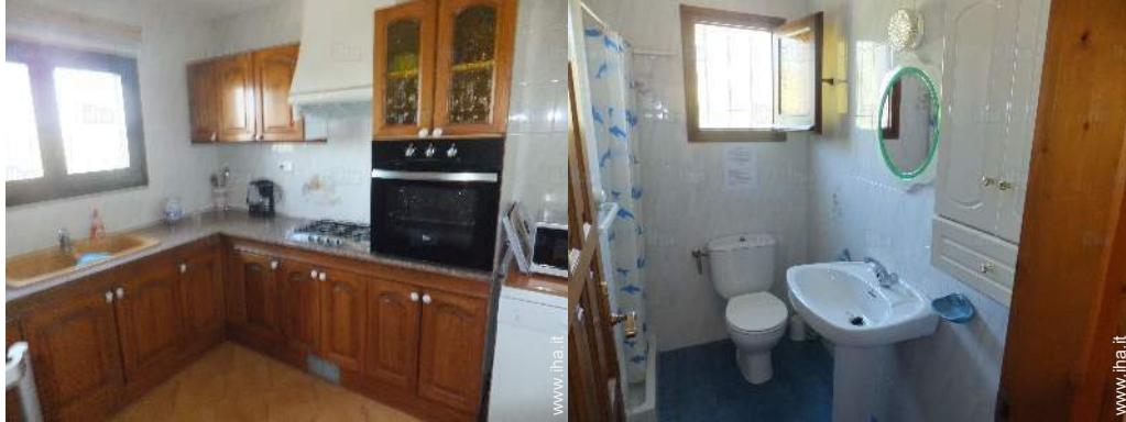
vista dalla cucina