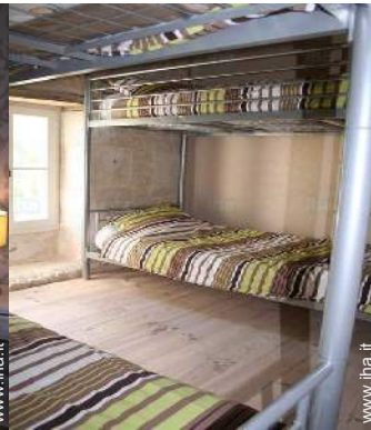
camera per ragazzi