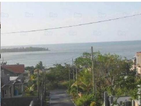
vista sul mare