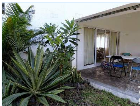
vista dalla veranda