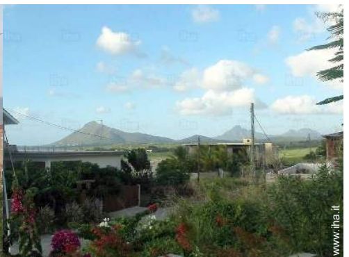
vista sulla montagna