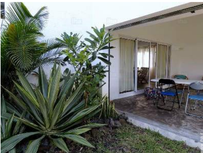
vista dalla veranda