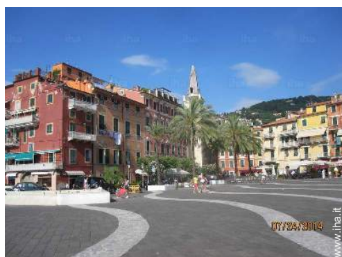
Città nelle vicinanze