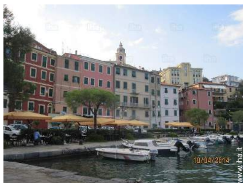
Città nelle vicinanze