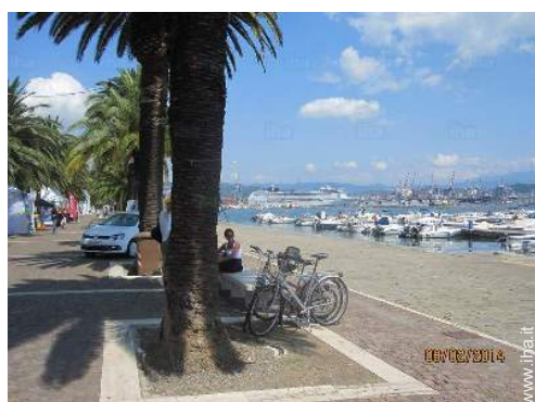
Attrazioni e relax