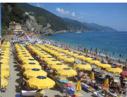
Città nelle vicinanze