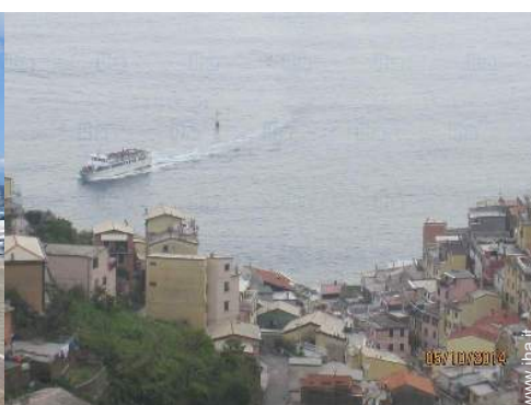
Città nelle vicinanze