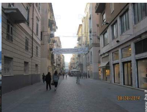
vista sul centro città