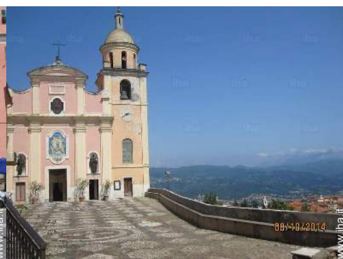
Città nelle vicinanze