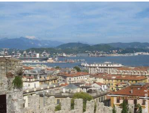
vista sulla città