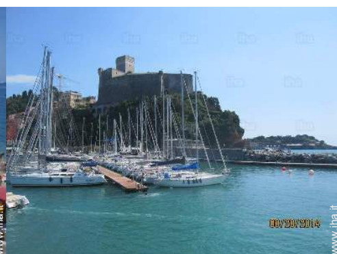
Città nelle vicinanze