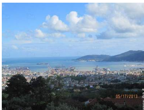
vista sulla città