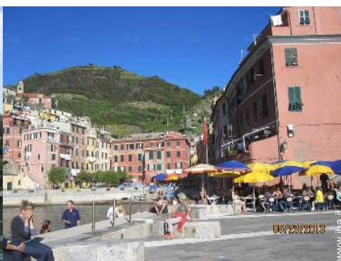
Città nelle vicinanze