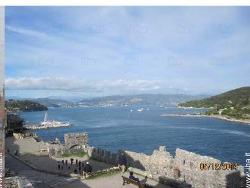
Città nelle vicinanze