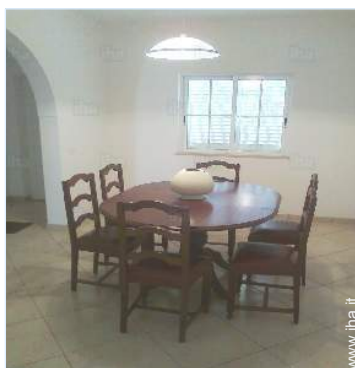
sala da pranzo