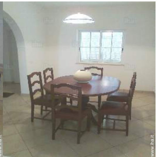
sala da pranzo