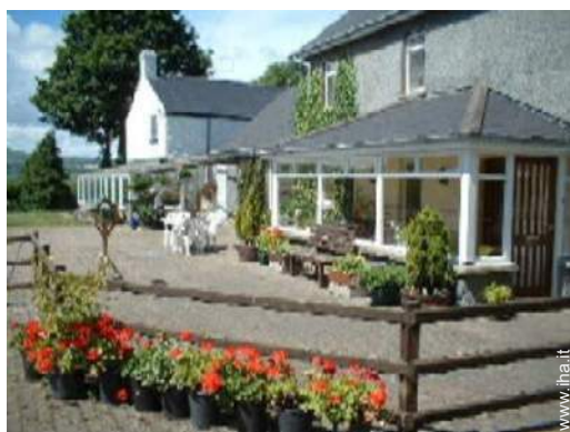
Il vostro ospite