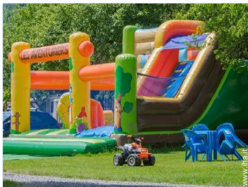
disposizione delle attrezzature ricreative