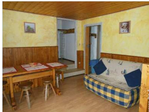
vista dal balcone