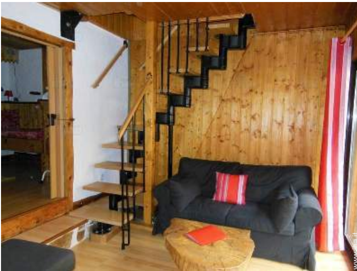
vista dal soggiorno