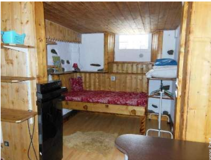
vista dal soggiorno