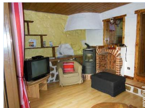
vista dal soggiorno

Villaggio centro 4km Noleggio auto 10km Noleggio attrezzatura di sci 15km Panetteria 4km Negozi tipici 4km Supermercato 10km Salone di coiffure 10km Ufficio postale 10km Banca 10km Distributore automatico di biglietti 10km Farmacia 10km Medico 15km Infermiera 10km Ospedale 25km