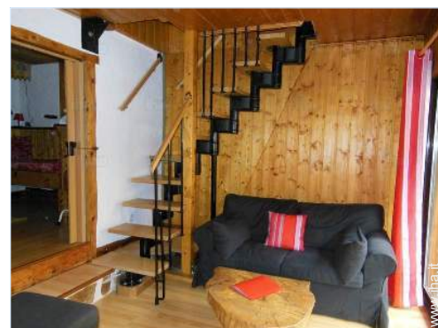
vista dal soggiorno