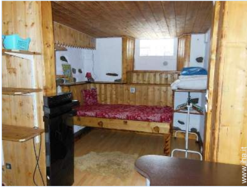
vista dal soggiorno