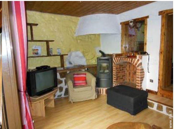
vista dal soggiorno