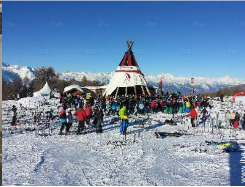
sport invernali nelle vicinanze