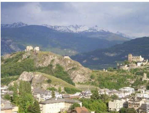
Città nelle vicinanze