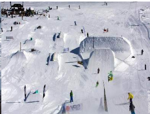
piste di sci