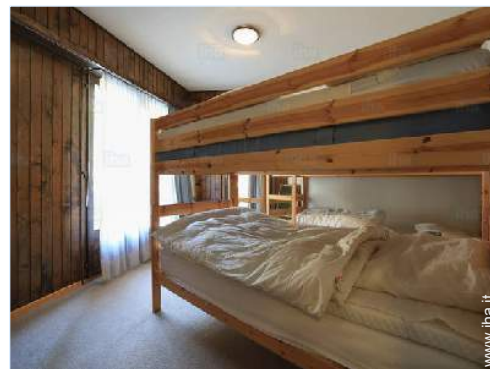
letti a castello

Tavolo da giardino, 6 sedia(e) da giardino