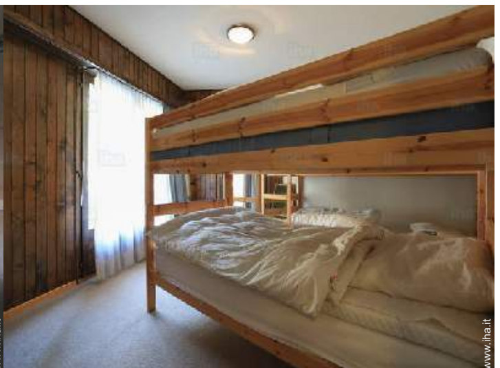
letti a castello