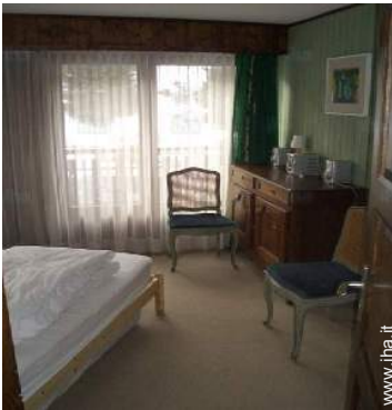
letti gemelli singoli