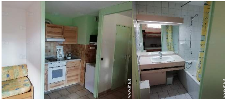
★ Emplacement de l'appartement au Lautaret