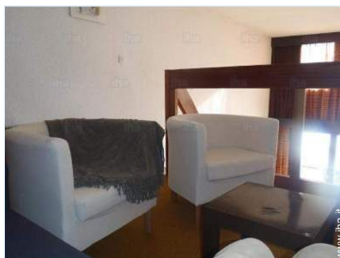
Disposizione interna e confort