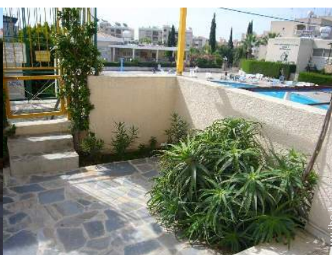
vista dal patio