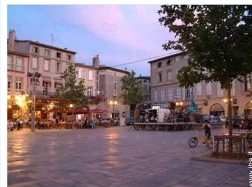
vista sul centro città