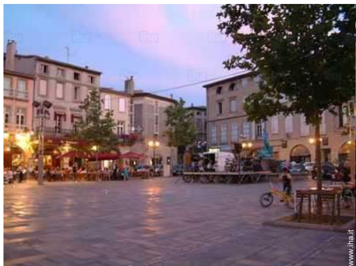
vista sul centro città