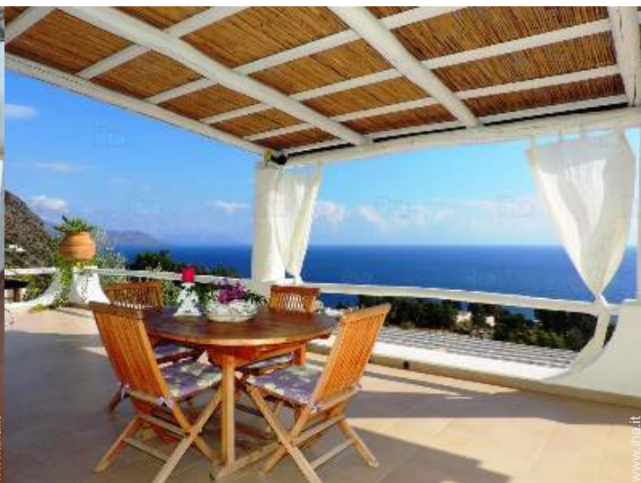
vista dalla casa