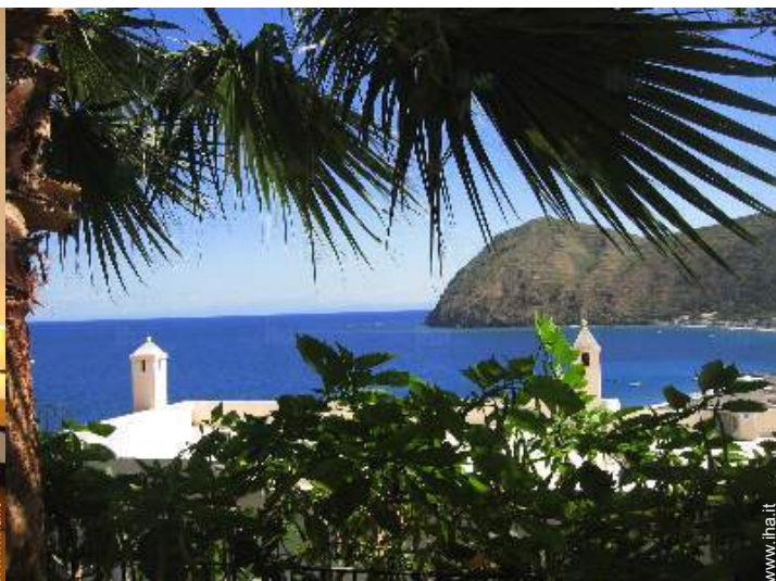
vista dal giardino/park