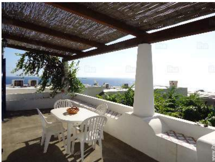
vista dalla casa