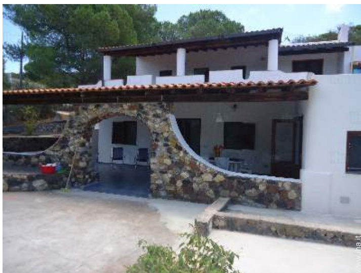
tavolo da giardino