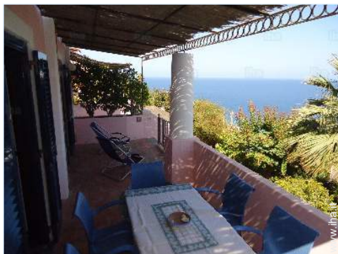
vista dalla casa