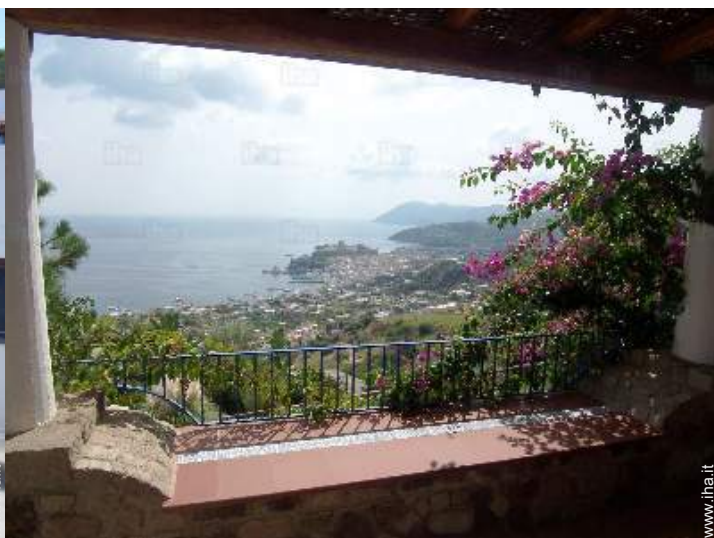
vista dalla casa