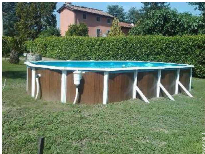
piscina fuori terra