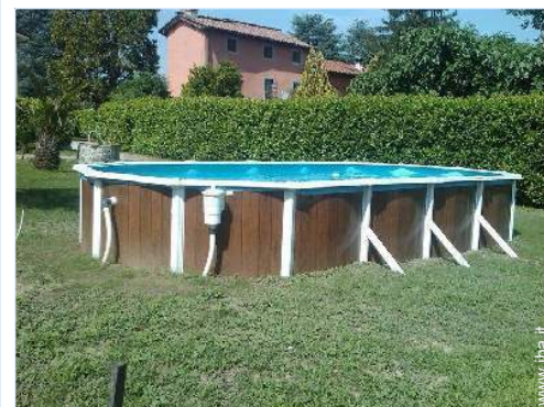
piscina fuori terra

Centro città 1km Fermata/stazionamento bus 100m Noleggio biciclette/mountain bike 1,5km Noleggio auto 1km Panetteria 500m Supermercato 100m Salone di coiffure 300m Ufficio postale 1km Banca 1km Farmacia 500m Medico 1km Ospedale 2km