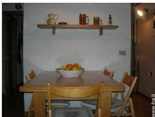
vista dal soggiorno