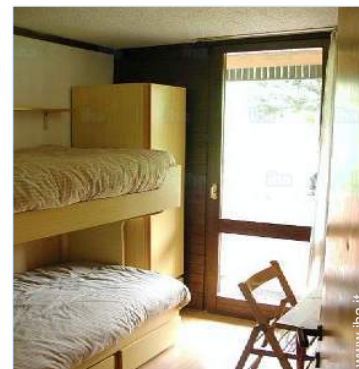
camera per ragazzi