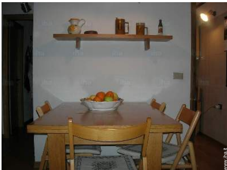
vista dal soggiorno