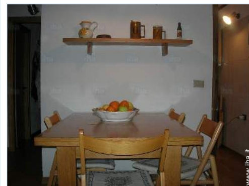
vista dal soggiorno

Villaggio centro 1,5km Fermata/stazionamento bus 300m Bus navetta piste di sci <50m Noleggio biciclette/mountain bike 1,5km Negozi tipici 1km Salone di coiffure 800m Ufficio postale 1,5km Banca 1,5km Farmacia 1km Medico 1km Ambulatorio 1km