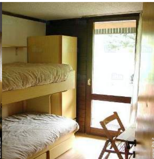
camera per ragazzi