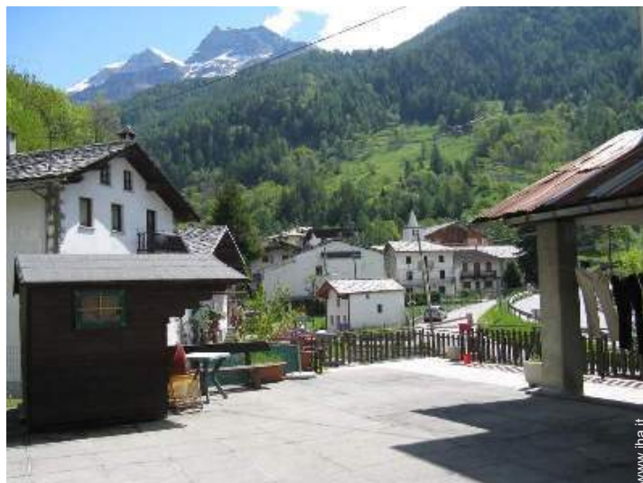
vista sul villaggio