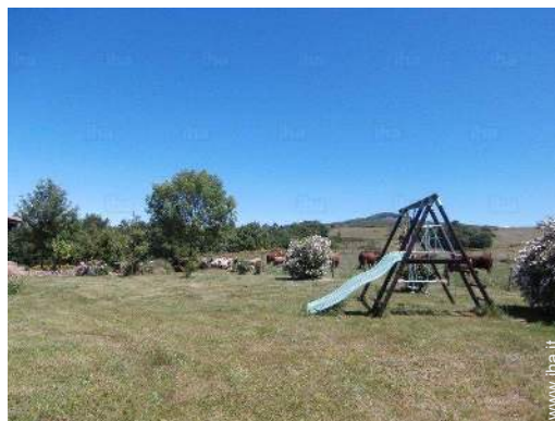
disposizione delle attrezzature ricreative