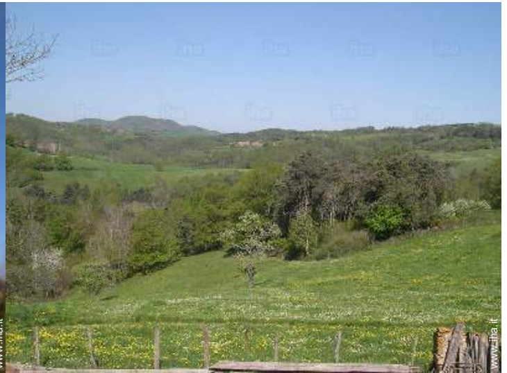
vista dalla camera