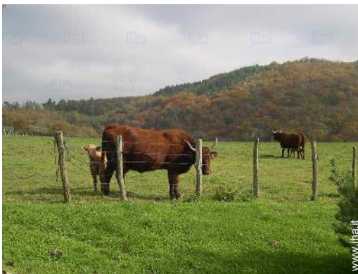
vista sulla campagna