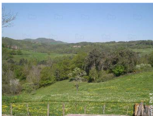
vista dalla camera