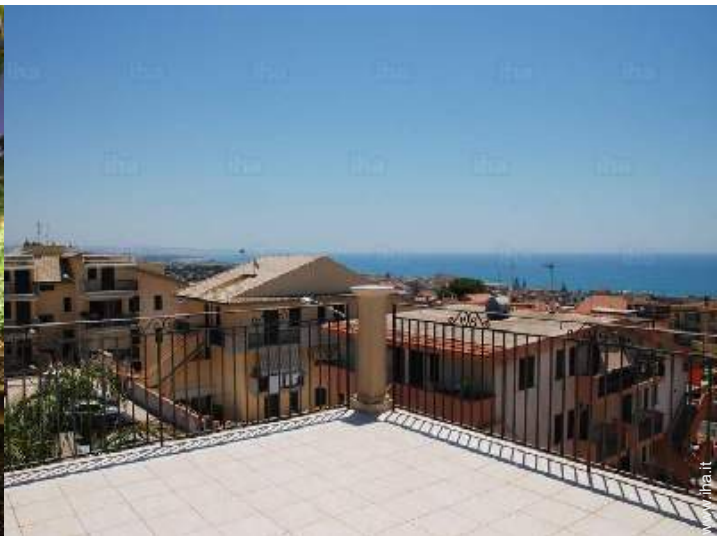
vista dalla veranda