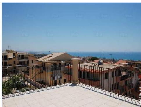
vista dalla veranda