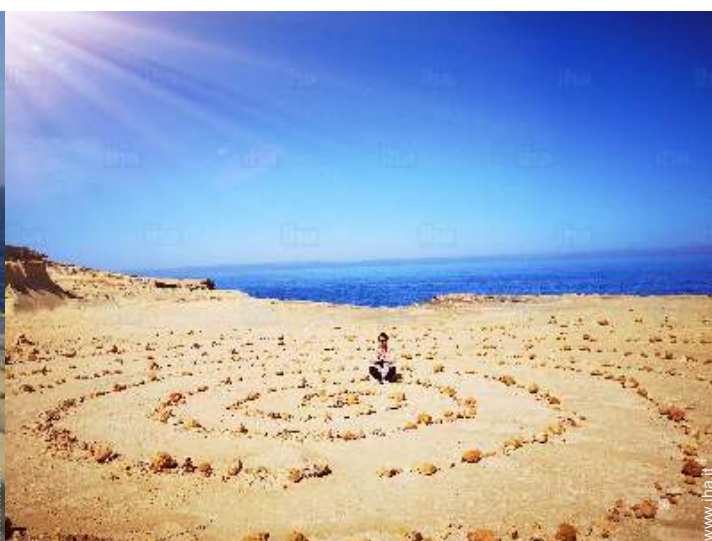
Attrazioni e relax