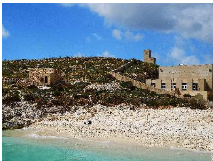
Attrazioni e relax