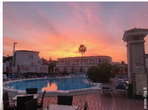
vista sulla piscina