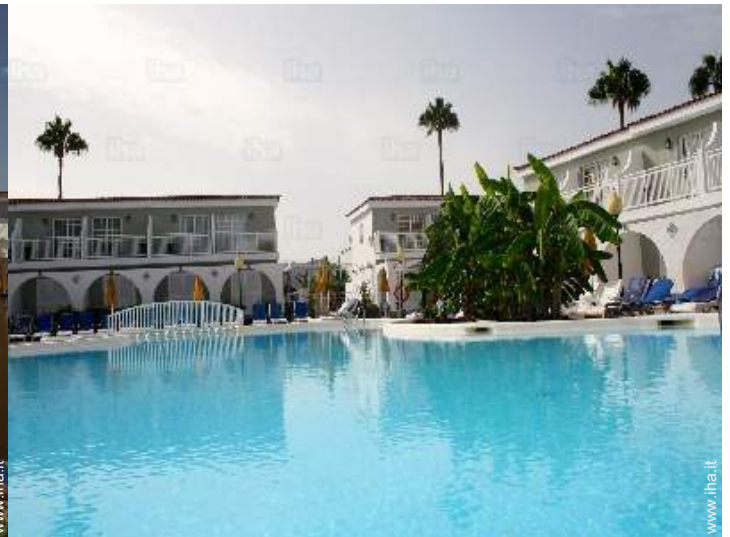
vista dalla piscina