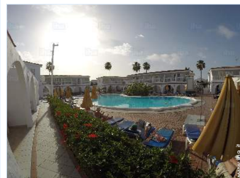
vista sulla piscina