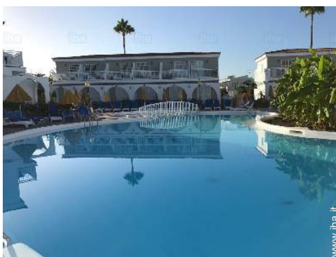
vista sulla piscina