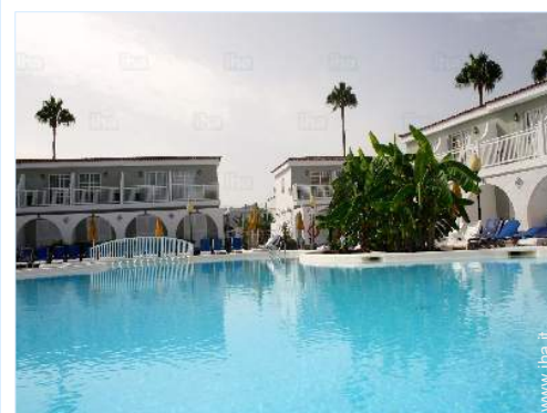
vista dalla piscina