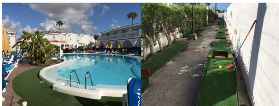
vista sulla piscina