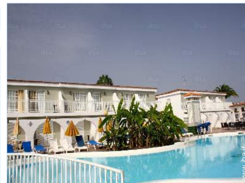
vista sulla piscina

Bar esterno, forno per pizze, ombrellone, chaise(s) longue(s)