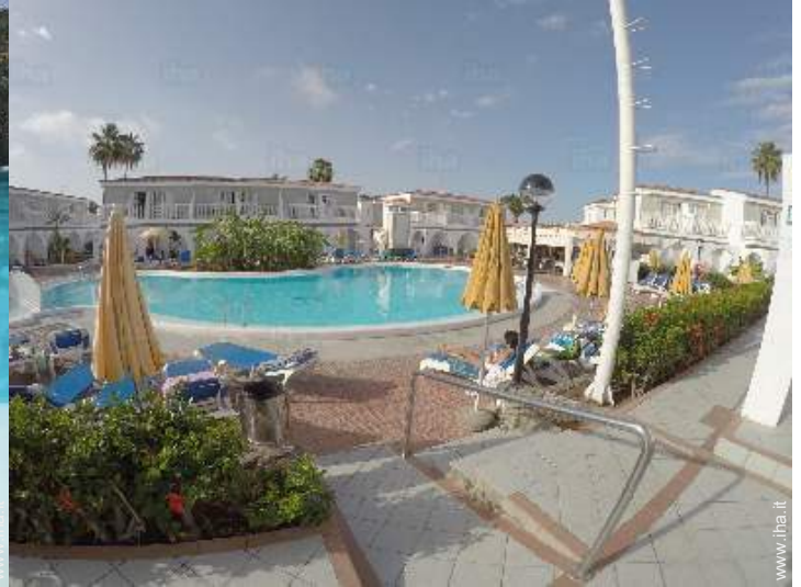
vista dalla piscina