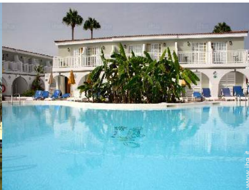
vista sulla piscina