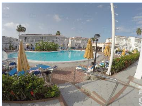
vista dalla piscina