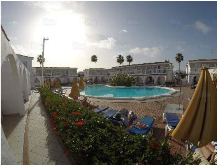
vista sulla piscina