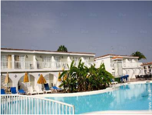
vista sulla piscina